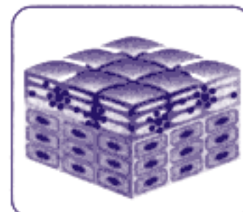
● 尿素 ● 水分