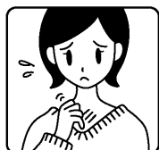
繊維刺激のカユミ