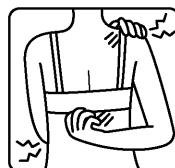
下着のしめつけに よるカユミ・かぶれ