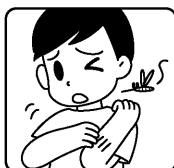
虫さされによる カユミ・炎症