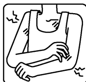
カサカサ肌による カユミ