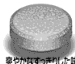
爽やかなすっきりした味

口の中でふわっと溶けるSP ® 錠。 しかも、のみやすい爽やかなすっきり した味。水なしでのめるから、ど んな場所でものむことができます。