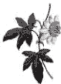
チャボトケイソウ